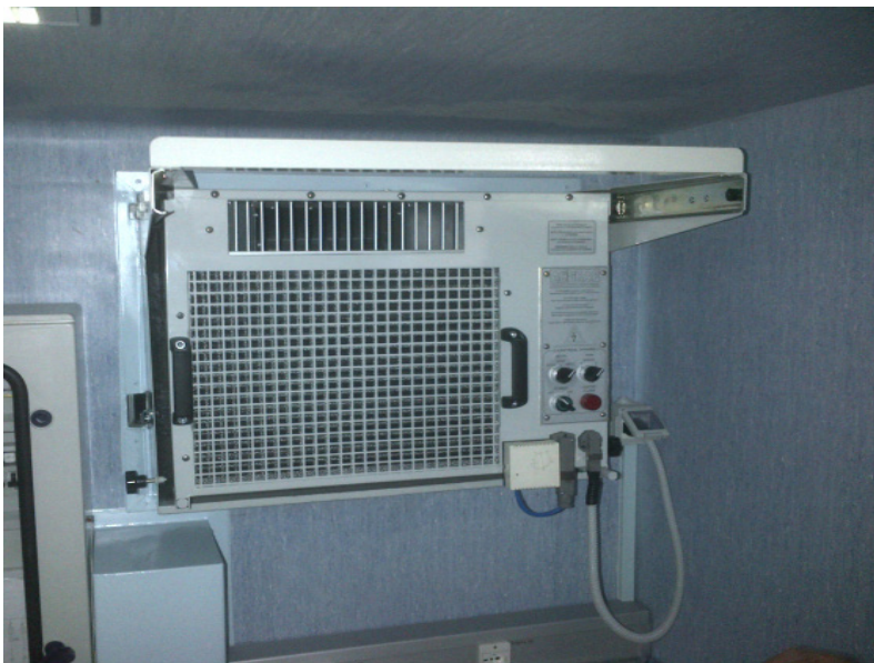
Esempio di montaggio su guide all'interno di uno shelter Example of rail-Mounting inside a shelter

Simple, compact and ready to use in every context, it's particularly suitable in adverse environments characterized by excessive heat and/or micro-particles.